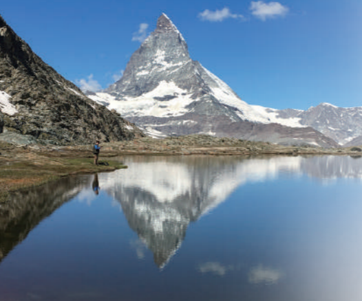
リュッフェルゼーから望む逆さまッターホルン