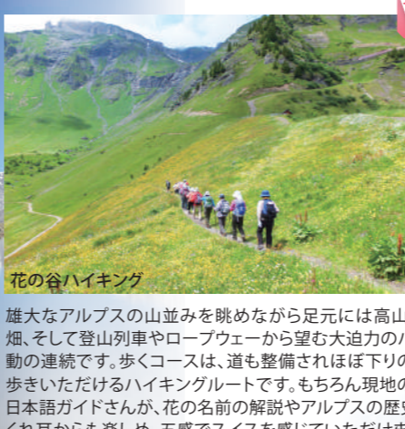
花の谷ハイキング

眺望と花を重視した 厳選コースをハイキング すべて公認ハイキング ガイドが同行します。